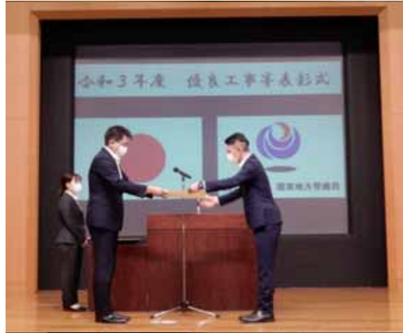
【代表者による表彰状の授与】