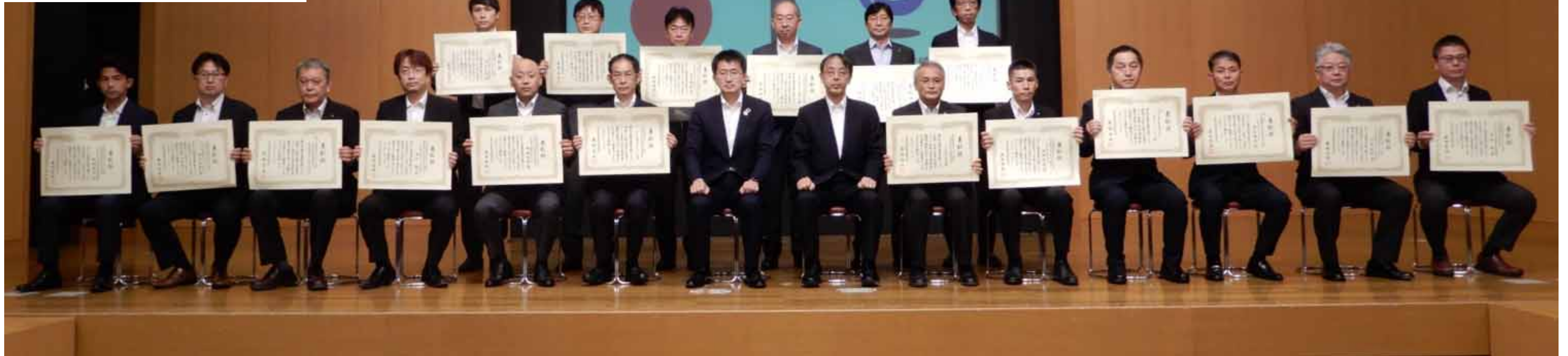
【優良業務、優良技術者、新技術推進技術者表彰 記念撮影】

新型コロナウイルス感染拡大防止のため、受賞内容ごとに表彰時間を区切り、代表者に表彰状を授与する等の対策がとられました。